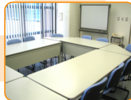
12 集会室 (14人)