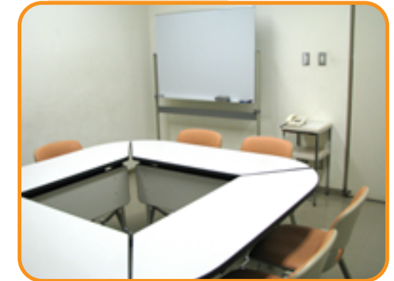
21 集会室 (12人)