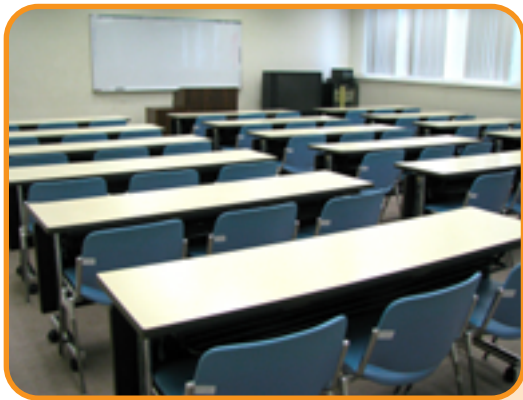
41 集会室 (54人)