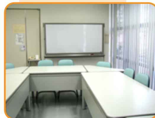
11 集会室 (14人)