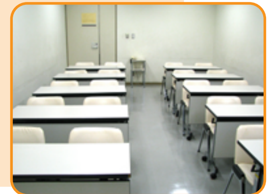
43 集会室 (20人)