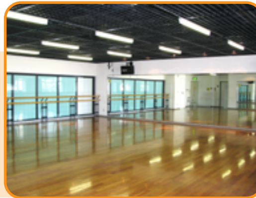
フィットネス<軽運動室> ルーム (30人)