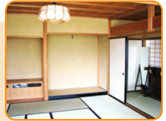
葵心庵 <茶室> (20人)