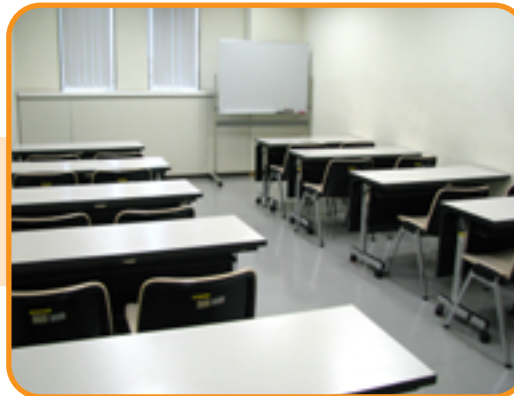
44 集会室 (20人)