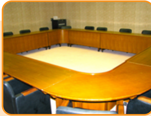
42 集会室 (22人)