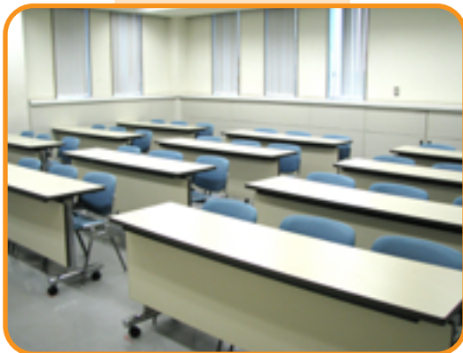
45 集会室 (36人)

※ 原則茶室としてご利用下さい。 小学生以下の入室不可。中学生の みのご利用はできません。