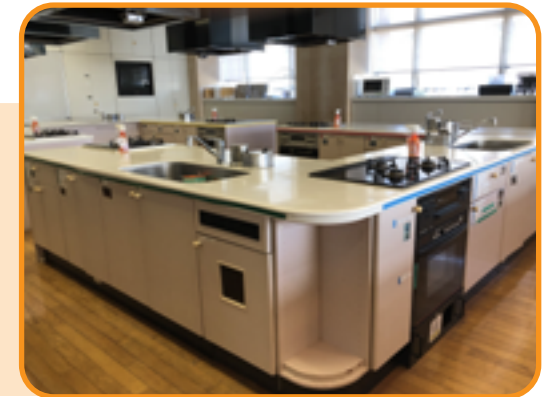
食工房<料理実習室> (32人)