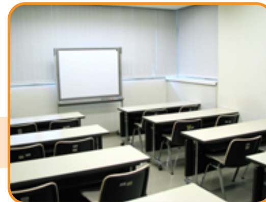
22 集会室 (18人)