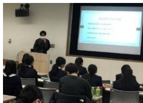
昨年度発表の様子