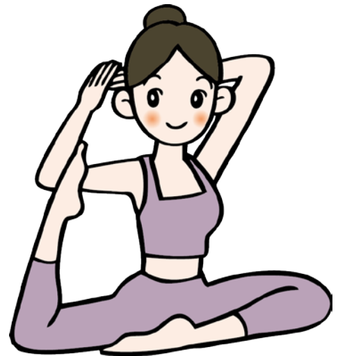
イラスト 田嶋三恵

自宅でも簡単にできるピラティスやエクササイズを 学んで、自分を大切にする時間を持ってみませんか。